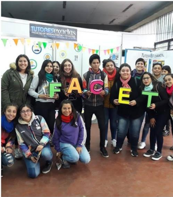
Muestra | Oferta Academ. Exactas para todos | UNT