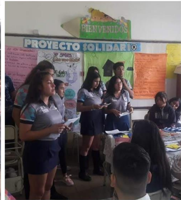
Visita Esc. Sec. El Cevilar