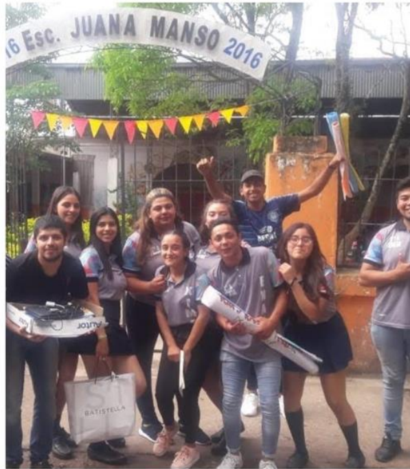
Visita Escuela Media J. Manso