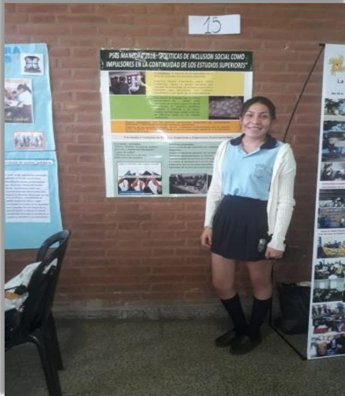
Encuentro Prov. de Esc. Solidarias Finalistas Premio Presidencial 2018