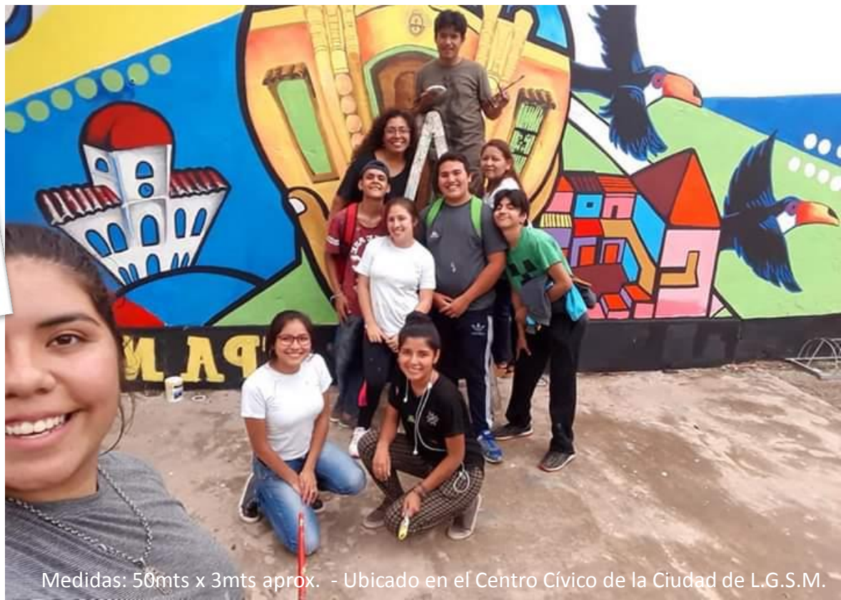
Medidas: 50mts x 3mts aprox. - Ubicado en el Centro Cívico de la Ciudad de L.G.S.M.